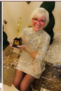
2023 in Dubai Award als beste Unternehmerin