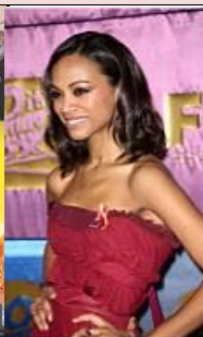
Nails für Golden Globes Zoë Saldana "Avatar"