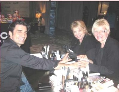
Nails für Golden Globes mit Gilles Marini "Sex and the City"