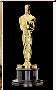
Nails für Oscar in Hollywood