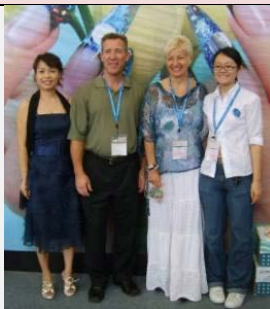
Arbeiten an Cosmoprof in China

Viele Jahre war sie Autorin für die Fachzeitschriften Nail Pro Deutschland und Beauty Forum Schweiz und Mitgründerin für den eidg. anerkannten Fachaussweis Nail Design.