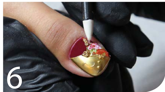
6 Der Nagel wird zum Schluss mit Mini-Kügelchen oder Strasssteinen im 3D-Look verziert.