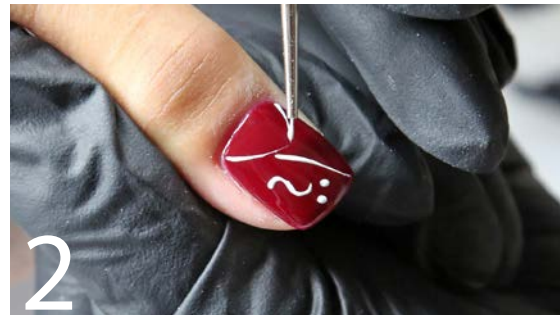
2 Zeichnen Sie mit einem weißen 3D-Gel ein erhabenes Reliefmuster auf den Nagel. Härten Sie anschließend aus.