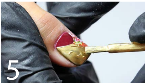
5 Nach dem Aushärten überziehen Sie den Nagel mit einem Finish-Gel, sodass die 3D-Zeichnung zur Geltung kommt.