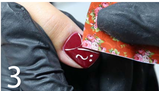
3 Auf einer Hälfte des Nagels wird eine Transferfolie auf die klebrige Schwitzschicht gedrückt und abgezogen.